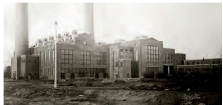
Das Kraftwerk 1924...

Im Dezember 1924 ist es so weit: Das Kraftwerk Unterweser in Farge geht mit 12 MW Turbinenleistung in Betrieb. Der Standort an der Weser ist für einen Kraftwerksbau prädestiniert: Die Kohle kann sowohl mit Hochseeschiffen an einem Kai angelandet als auch auf einer nahegelegenen Normalspurbahn herangeschafft werden. Für ausreichende Mengen Kühlwasser sorgt die Weser selbst.