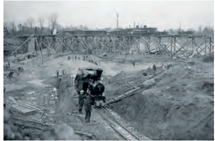
Bau des Kraftwerks von 1922 bis 1924. Erste Erdarbeiten