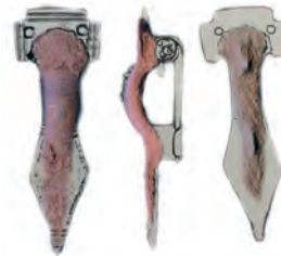
Gefundenes Teil einer Bügelfibel mit zeichnerischer Überlagerung des typischen Aussehens, [1]

Ich suche deshalb inzwischen schon seit über einem Jahr, in enger Zusammenarbeit mit der Landesarchäologie Bremen, mit einem Metalldetektor nach Gegenständen aus Metall auf Ackerflächen in Rekum. Das Suchen mit einem Metalldetektor