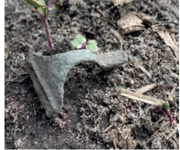
Gefundenes Teil einer Stützarmfibel

Auf den ersten Blick stellen sich viele darunter Jemanden vor, der eine große Schatztruhe mit viel Gold sucht. In Wahrheit finden wohl nur die allerwenigsten Menschen einen solchen „klassischen“ Schatz.