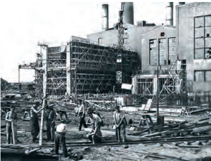
Vierte Erweiterung 1950/51