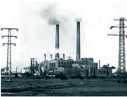
...und in den 20er und 30er Jahren