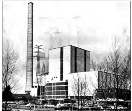
Der 320 MW Block 1 des Kraftwerk Farge