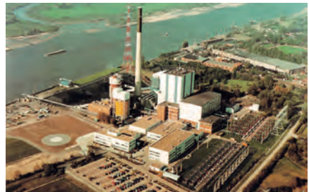
Kraftwerk Farge 1990 mit Rauchgasentschwefelungsanlage, [3]

sind der Lokalzeitung „Beweis für die Wirksamkeit“ der zusätzlichen Elektro-Staubfilter, mit denen in den 70er Jahren sowohl das Altwerk als auch der neue Block I ausgestattet worden sind. 1988 folgt eine Rauchgasentschwefelungsanlage.