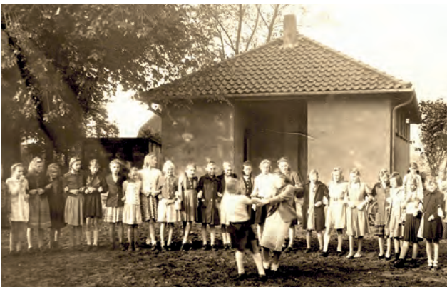
Das alte Toilettenhaus 1949

also Plumpsklos. Auch als 1953-1954 die Schule vergrößert wurde, wurden die Abwässer weiterhin in die Fäkaliengrube unter dem alten Toilettenhaus eingeleitet. Man kann sich gut vorstellen,