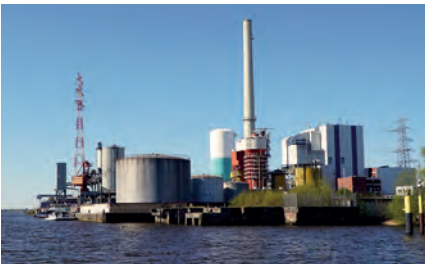
Das Kraftwerk Farge 2022

Ukrainekrieg (seit Februar 2022), entstand bundesweit eine Gas-mangellage. Dies führte dazu, dass das Kraftwerk Farge noch bis 31. März 2024 weiter betrieben werden kann. Die Anlage wird dann voraussichtlich stillgelegt und vom Netz gehen. Der Standort Farge soll allerdings zur Energieerzeugung durch die Onyx Power Group erhalten bleiben. Welche Technologie oder welcher Brennstoff in Zukunft eingesetzt wird, ist derzeit noch völlig offen. Eine Option ist der Aufbau einer Wasserstoffproduktionskapazität. Es besteht also eine gewisse Chance, auch wegen des Schiffsanlegers und der Hochspannungsleitungen, dass Farge auch in Zukunft als Energieumschlagplatz erhalten bleibt, [6].