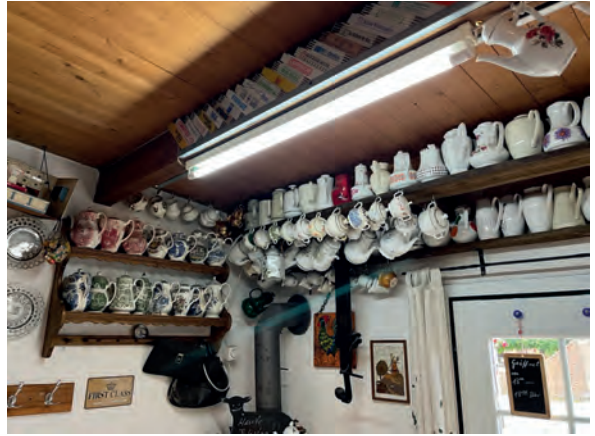
Kuriositäten im Café bei Meyers – Kaffeekannen und Zollstöcke