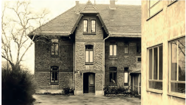
Schule Reikum – Altbau ca. 1962

Nach Schulschluss haben sich einige Schüler unserer Klasse re-