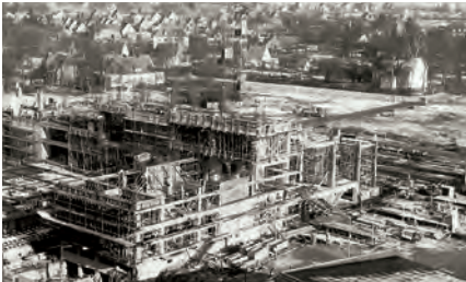
Bauarbeiten Block 1 1967

Ab 1985 begann der Abriss des Altwerkes. Schon Anfang der 1960er Jahre wurde der erste markante,