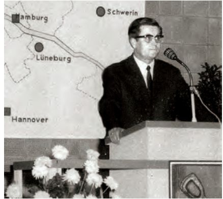
Der Bremer Bürgermeister Hans Koschnick hält die Festrede