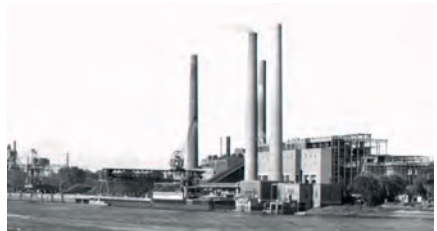
Rohbau des Kesselhauses im Zuge der fünften Erweiterung im Jahr 1953