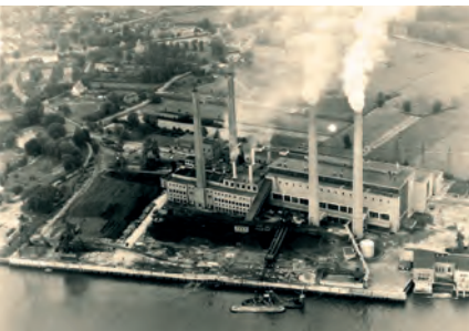
Das Kraftwerk nach Fertigstellung der Erweiterungsmaßnahmen 1954