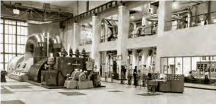
Der neue 70 MW Hochdruck-Kondensations-Turbosatz Nr. VII