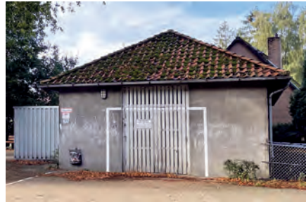
Das alte Toilettenhaus heute

Das alte Toilettenhaus gibt es immer noch, es wurde ein Geräteschuppen für dem Hausmeister und eine Fahrradgarage für die Schüler der Schule.