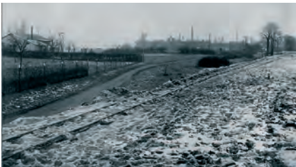
Das Kraftwerksgelände im Dezember 1916. Im Hintergrund die Witteburg Fabrik

„Die Absichten, von denen die Gründer der Gesellschaft geleitet waren, zielten darauf, durch die Errichtung eines Kraftwerkes in Farge a. d. Unterweser und eines Hauptschalt- und Umspannwerkes in dem benachbarten Berne, das an der Unterweser gelegene, industriell und landwirtschaftlich bedeutsame Gebiet, mit Licht und Kraft zu versorgen“.