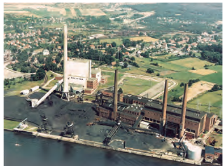
Kraftwerk Farge Block 1 und Altwerk ca.1980, [2]