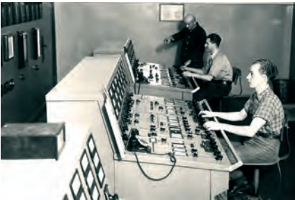
Wärmewarte für die Kessel 15/16/17 zu Beginn der 50er Jahre