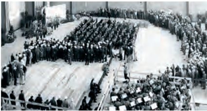
Einweihung der Maschinenhalle von Block 1, 1968