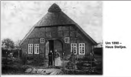
Um 1890 – Haus Steljes.

Von der Landesgrenze (Rekumer Straße 203) führte die Präsentation dann Haus für Haus zurück bis zum Sportplatz mit dem Jugendheim (Rekumer Straße 2). Weitere kurze Filmclips vom Leben der Rekumer Bewohner (Müller, Bauern, Bäcker, Lebensmittelhändler) in den 60er Jahren lockerten den Beitrag auf.