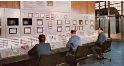
Leitstand des 320 MW Block 1 bei der Inbetriebnahme 1968/69