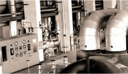
Turbine Nr. VI