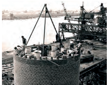
Bau eines neuen Schornsteins