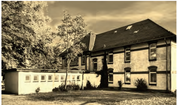
Toilettenanbau hinter dem Altbau, erbaut 1966/1967

gelmäßig im Jugendfreizeitheim Farge getroffen. In diesem Haus gab es Gemeinschafts-, Werkstatt-räume und ein Tonstudio. In dem