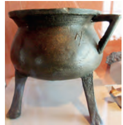
Beispiel eines Bronzegrapen, 15. Jahrh. [2]