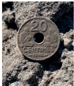
20 Centime, 1942