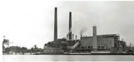
Dritter Schornstein bei der Erweiterung des Kraftwerks 1951